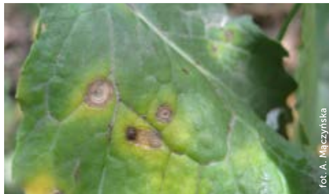
Fot. 3. Symptomy czerni krzyżowych na liściach rzepaku

W okresie wiosennym należy również zadbać o zahamowanie rozwoju czerni krzyżowych, której sprawcą są grzyby rodzaju Alternaria . Charakterystyczne koncentryczne plamy pojawiają się na liściach już w okresie jesiennej wegetacji.