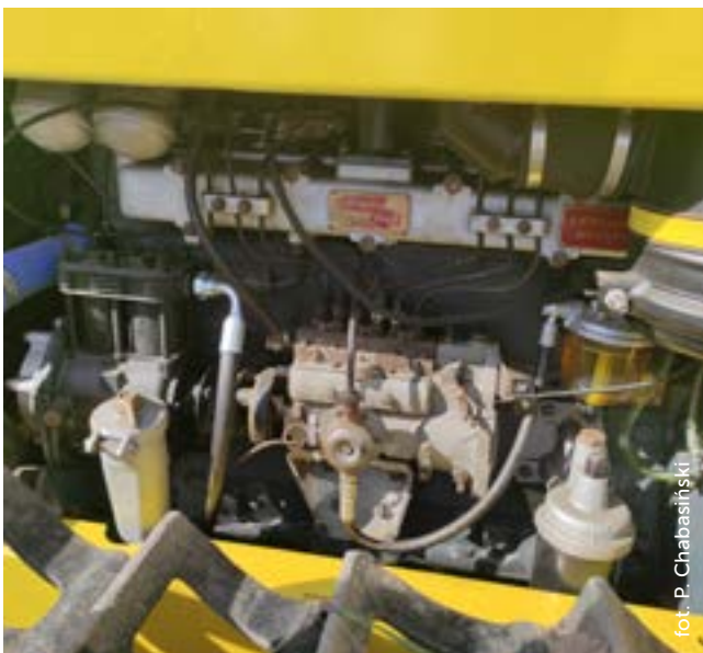
Silnik wysokoprężny Leyland UE-400 Plus Power o mocy 97 KM. Wyraźnie widoczna jest zachowana oryginalna pompa paliwowa.

Początkowe modele ciągnika nie posiadały kabiny. Na późniejszym etapie, przy współpracy z projektantami wzornictwa przemysłowego, opracowano nowoczesny wygląd ciągnika z charakterystycznie pochyloną przednią szybą i maską. Jednak w serii pilotażowej zdecydowano się na rezygnację z tych innowacyjnych elementów, wybierając tradycyjną, dwuosobową kabinę.