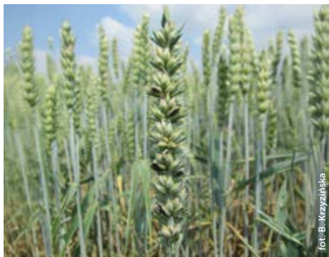
Fot. 5. Objawy śnieci cuchnącej pszenicy

Artykuł opracowano w ramach dotacji celowej Instytutu Ochrony Roślin – PIB na rok 2024, na realizację zadania 3.1. pn. „Prowadzenie działalności upowszechnieniowej, prowadzenie współpracy i wymiana wiedzy z praktyką w ramach systemu AKIS” finansowanego przez Ministerstwo Rolnictwa i Rozwoju Wsi. Artykuł został udostępniony do opublikowania wszystkim czasopismom wydawanym przez wojewódzkie jednostki doradztwa rolniczego.