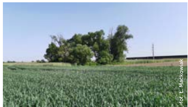
Fot. 3. Zadrzewiona skarpa