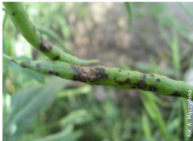
Fot. 4. Czern krzyżowych na łuszczyinach rzepaku

Wiosną po ruszeniu wegetacji należy ograniczyć do minimum infekcje liści, które stanowią źródło porażenia łuszczyń. To właśnie symptomy czerni krzyżowych na tych organach są najbardziej szkodliwe dla uprawy rzepaku, powodując przedwczesne ich zasychanie, pękanie i osypywanie się nasion.