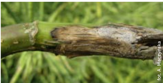
Fot. 2. Silne objawy suchej zgnilizny kapustnych na szypkach korzeniowych rzepaku

Wiosną w piknidiach obecnych na liściach powstają zarodniki konidialne odpowiedzialne za infekcje wtórne. Grzyb przez tkanki i nerwy blaszek liściowych przerasta do podstawy pędu. Jeżeli wczesną wiosną nie wykona się zabiegu fungicydowego, choroba szybko się rozwinie, przerośnie do pędu, nastąpi przerwanie wiązek przewodzących, co może doprowadzić do zamierania całych roślin.