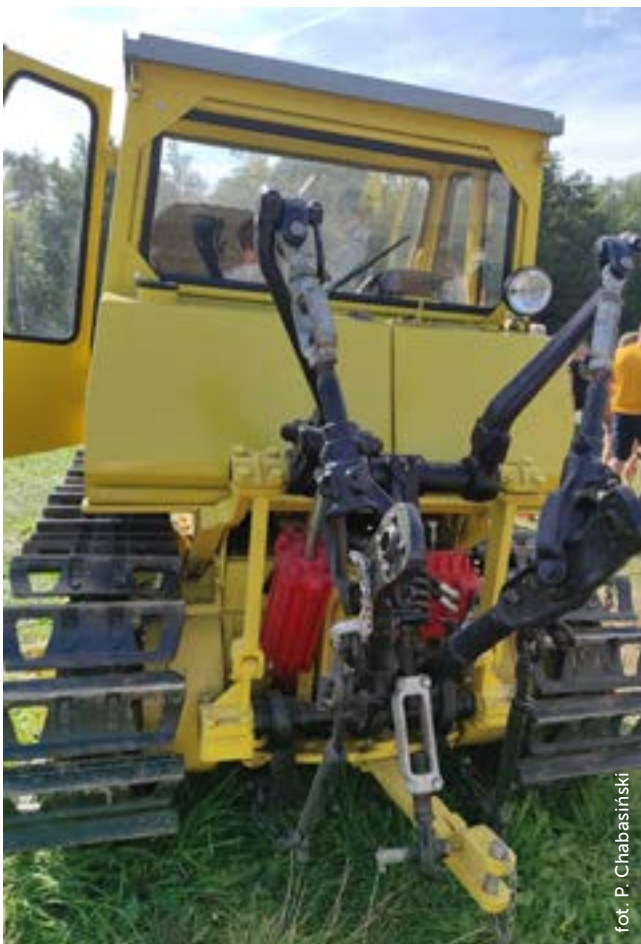
Tylny trójpunktowy układ zawieszenia, montowany w ciągniku w wersji rolniczej

Początkowe modele ciągnika nie posiadały kabiny. Na późniejszym etapie, przy współpracy z projektantami wzornictwa przemysłowego, opracowano nowoczesny wygląd ciągnika z charakterystycznie pochyloną przednią szybą i maską. Jednak w serii pilotażowej zdecydowano się na rezygnację z tych innowacyjnych elementów, wybierając tradycyjną, dwuosobową kabinę.