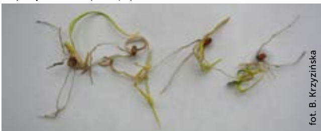
Fot. 1. Objawy zgorzeli siewek

Zwalczanie: odpowiedni płodozmian i rotacja w uprawie zbóż. Prawidłowa agrotechnika i głęboka orka umożliwiająca rozkład resztek poźniowych przed siewem zbóż. Do siewu należy wykorzystywać kwalifikowany materiał siewny lub przeznaczyć nasiona o dobrej zdrowotności. Materiał siewny należy zaprawić przed siewem.