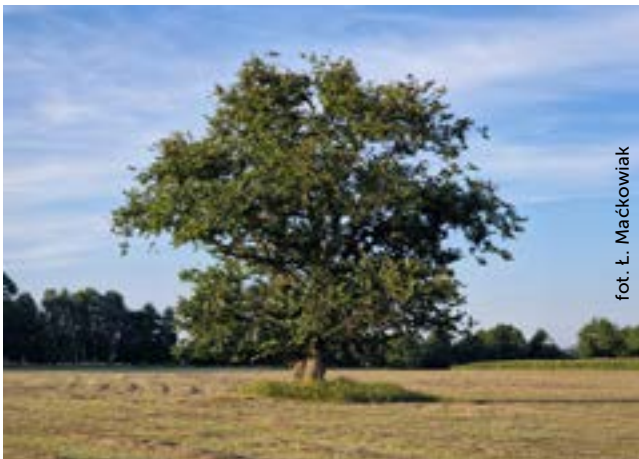
Fot. 1. Czyżnie