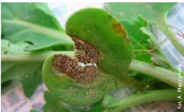
Fot. 1. Sucha zgnilizna kapustnych – objawy porażenia na młodych roślinach rzepaku

Wiosną w piknidiach obecnych na liściach powstają zarodniki konidialne odpowiedzialne za infekcje wtórne. Grzyb przez tkanki i nerwy blaszek liściowych przerasta do podstawy pędu. Jeżeli wczesną wiosną nie wykona się zabiegu fungicydowego, choroba szybko się rozwinie, przerośnie do pędu, nastąpi przerwanie wiązek przewodzących, co może doprowadzić do zamierania całych roślin.