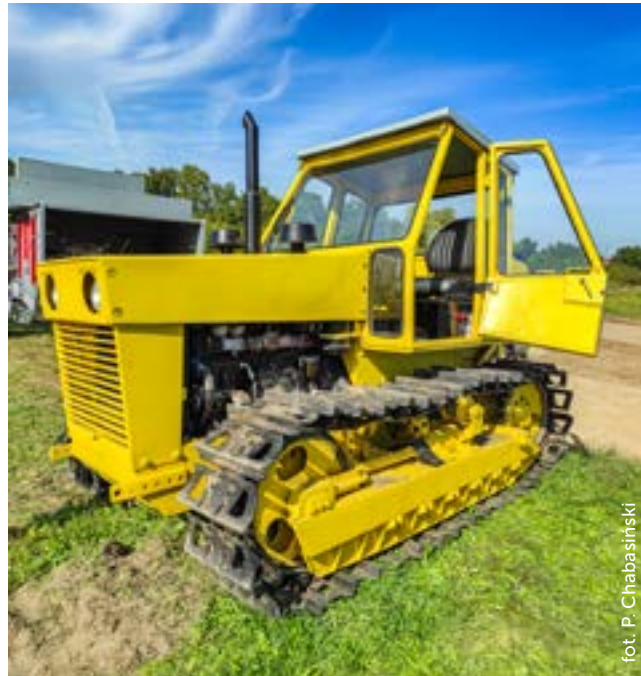
Ciągnik gąsienicowy Piast G-75 R – zachowany egzemplarz w Muzeum Narodowym Rolnictwa i Przemysłu Rolno-Spożywczego w Szreniawie

oraz siewkarniach Orkan. Prototypowy model Piastra, co możemy dostrzec oglądając zachowany egzemplarz w Muzeum Narodowym Rolnictwa i Przemysłu Rolno-Spożywczego w Szreniawie, wyposażono w silnik z oryginalną pompą paliwową Siemens-Leyland oraz membranową pompką zasilającą. W wielu innych maszynach, w których montowano silniki Leylanda, pompy te były wymieniane na polskie konstrukcje.