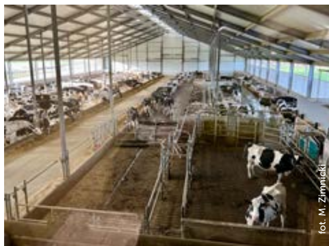
Obora mieści obecnie 200 krów i pracują w niej trzy roboty udojowe