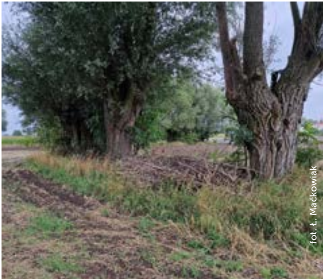
Fot. 5. Wierzby głowiaste

Ponadto korzystny wpływ na agrocenozy zadrzewień to nie-materialny pożytek dla rolnika. Usługi ekosystemowe, które zapewniają zadrzewienia śródpolne odgrywają ważną rolę w budowaniu plonu i jakości produktu rolnego. Wiodącą rolę mają usługi regulacyjne i wspomagające. Te pierwsze związane są z ochroną gruntów przed erozją, kształtowaniem klimatu lokalnego oraz oczyszczaniem środowiska z nadmiaru środków nawozowych i innych substancji. Natomiast usługi wspomagające dotyczą głównie miejsca do bytowania gatunków w krajobrazie rolniczym. Przekłada się to na wkład w ochronę ich siedlisk, zwiększenie ogólnej bioróżnorodności otoczenia.