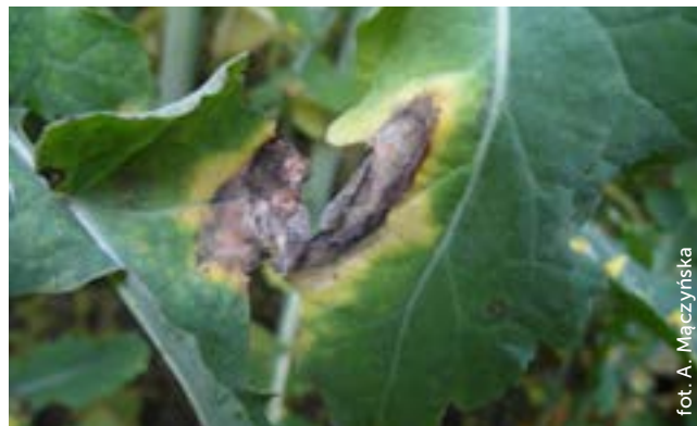
Fot. 5. Szara pleśń na liściach rzepaku – nekrozy pokryte szarobrunatnym nalotem trzonków konidialnych z zarodnikami

Nie można zapominać również o szarej pleśni, która doskonale rozwija się na przedwiośniu i wiosną w warunkach chłodnej i wilgotnej pogody, a jej rozwojowi sprzyjają uszkodzenia roślin, zarówno te mechaniczne, jak i powodowane przez mróz. Szara pleśń w sprzyjających warunkach w szybkim tempie niszczy blaszki liściowe i pędy, powodując zamieranie roślin (fot. 5).