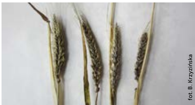
Fot. 4. Objawy porażenia kłosów jęczmienia przez głównię zwartą

Zwalczanie: stosowanie doczyszczzonego, zdrowego i prawidłowo zaprawionego materiału siewnego.