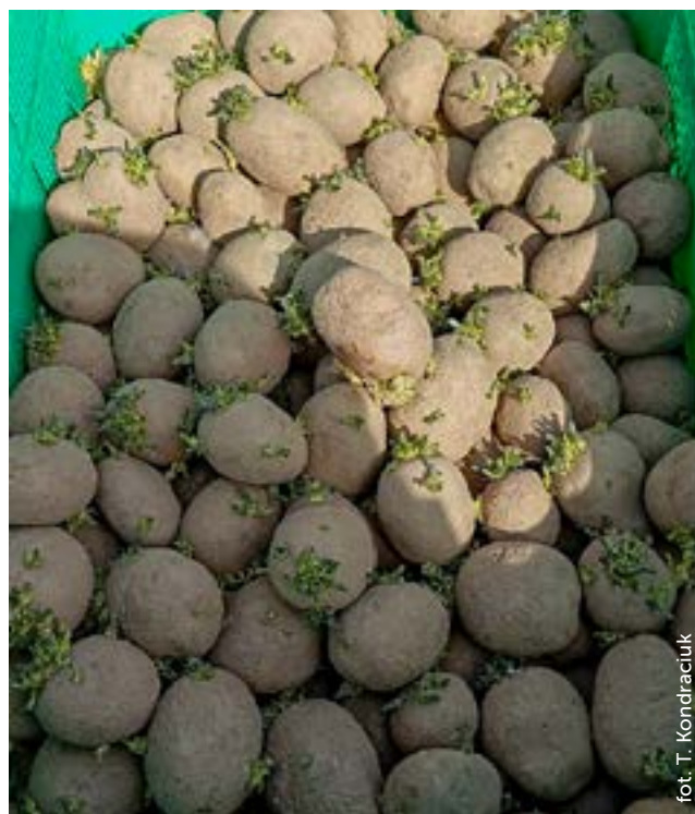
fol. T. Kondraciuk

Chotkowski J. 2012 Produkcja i rynek ziemniaka redakcja naukowa Wieś Jutra,