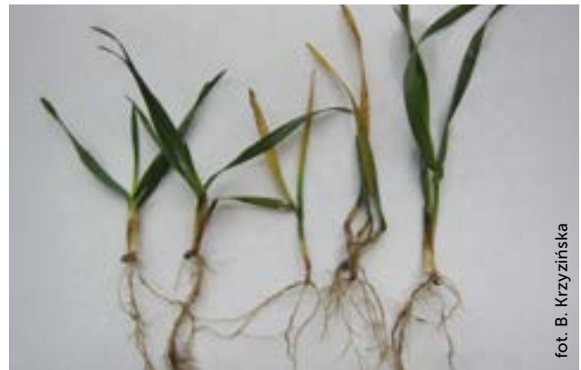
Fot. 2. Młode rośliny jęczmienia ozimego z objawami rizoktoniozy zbóż

Zwalczanie: odpowiedni płodozmian i rotacja w uprawie zbóż. Prawidłowa agrotechnika i głęboka orka umożliwiająca rozkład resztek poźniowych przed siewem zbóż. Do siewu należy wykorzystywać kwalifikowany materiał siewny lub przeznaczyć nasiona o dobrej zdrowotności. Materiał siewny należy zaprawić przed siewem.